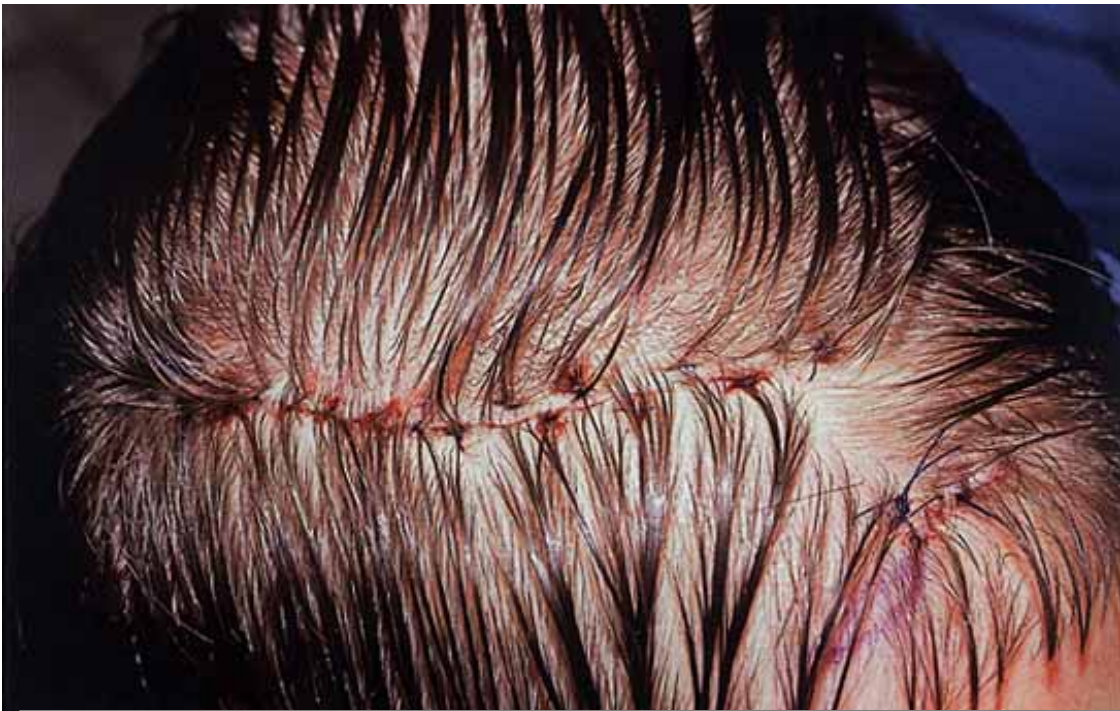
Suture complète des deux berges de la plaie