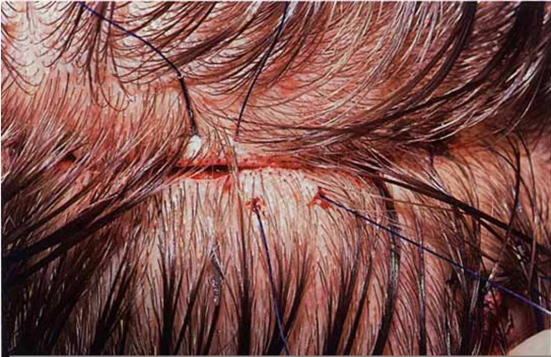
Réalisation d'une suture cuticulaire.